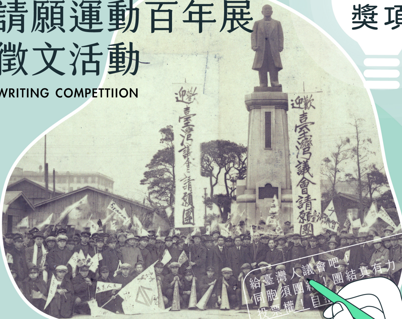
臺灣議會設置請願團在東京火車站合影 (授權：中央研究院)